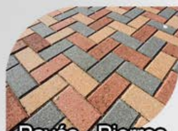
Pavés - Pierres

CURE ACTION RAVIVANTE ANTITACHE DURABILITÉ