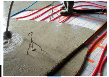
Mortiers de chapes fluides ou bétons de dalles fluides