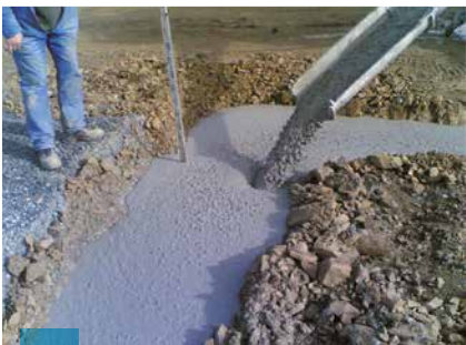
Semelles filantes Maisons Individuelles