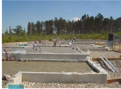
Dallages terre-plein Maisons Individuelles